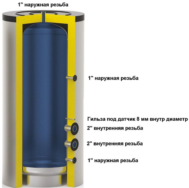
Схема бака серии АТР ELECTRO ЭМАЛЬ